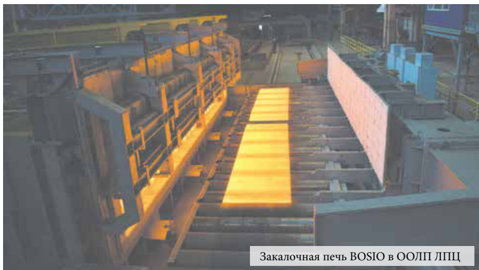
Закалочная печь BOSIO в ООЛП ЛПЦ

21 октября 1967 года Центральный Комитет КПСС, Президиум Верховного Совета СССР, Совет Министров СССР и Всесоюзный Центральный Совет профессиональных союзов наградили памятным Знаменем трудовой коллектив металлургического завода «Красный Октябрь» — победителя социалистического соревнования по Волгоградской области, проходившего в честь 50-летия Великой Октябрьской Социалистической революции. С тех пор Знамя хранится в музее истории завода.